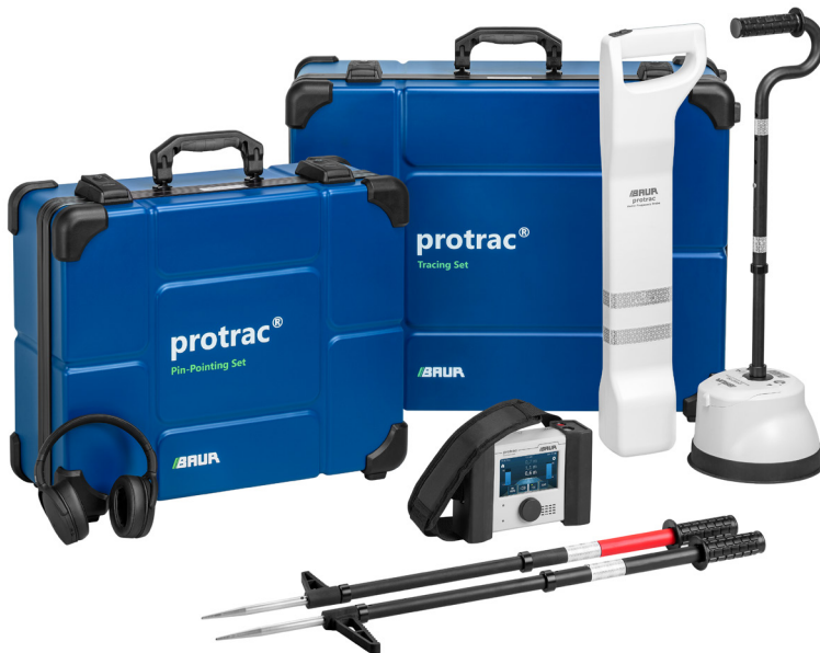
Prikaz kao primer