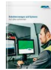
Kabelmesswagen und Systeme