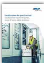
Localizzazione dei guasti nei cavi