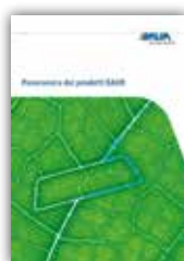
Panoramica dei prodotti