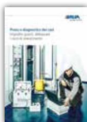
Prova e diagnostica dei cavi