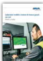
Laboratori mobili e sistemi di ricerca guasti sui cavi