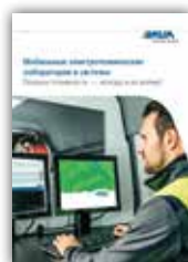
Мобильные электро-технические лаборатории и системы