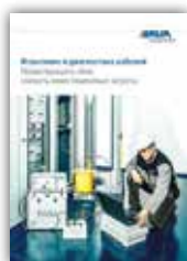
Испытание и диагностика кабеля