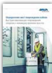
Определение мест повреждения кабеля