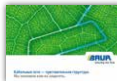
Брошюра о компании