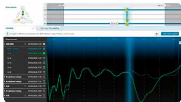
BAUR 软件 4 的显示器可以一目了然地显示出所有重要的设置、电缆故障定位参数以及电缆数据。屏幕的下方显示测量结果，并可以立即记录重要的结果。