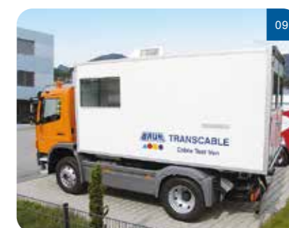
01 / 高压区选项示例: 电动电缆卷筒架、外部紧急关闭装置和 TDR 连接电缆 02 / 带有储藏空间的座椅箱选项示例 03 / 带有合适衬垫的抽屉选项示例 04 / 空调设备示例 05 / 底部同步发电机示例 06 / 电子发电机示例 07 / 信号灯 08 / 警示灯 09 / 使用 BAUR 装备的各种规格的测试车。