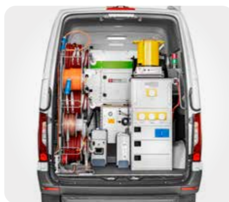
↑ titron® 系统