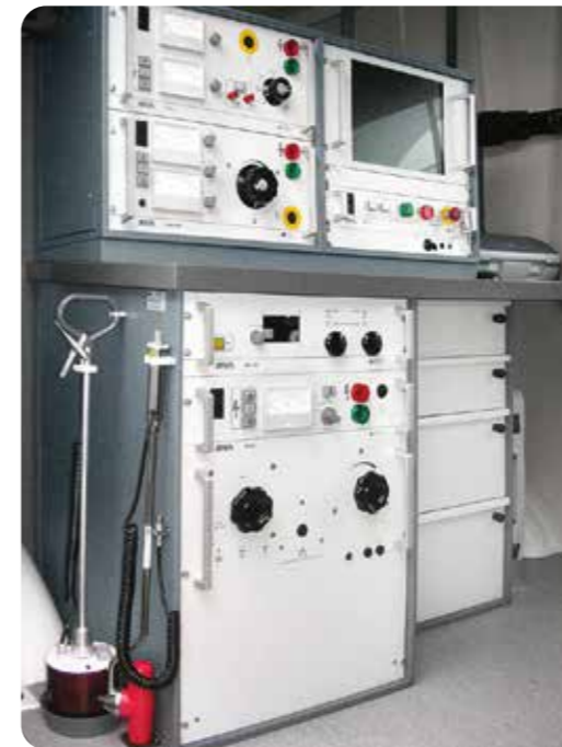
↓ 扩展的 Syscompact 3000 系统