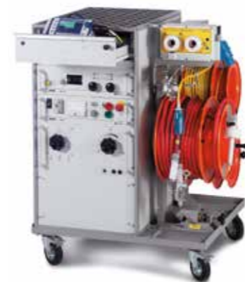
↑ Syscompact 2000 紧凑的结构使其便于运输，并且适合于安装在厢式车中。

可靠地完成工作。您可根据自己的需要个性化选择装备和结构。Syscompact 可配备滚轮作为便携式系统或作为设备模块安装在测量车中 - 是优化预算或低预算但要求高性能时的基础性选择。