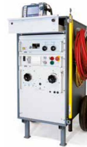
↑ Syscompact 2000 portable 用于预定位和精确定位中低压电缆上的电缆故障，特别适合移动用途，并且无需进行永久的车载安装。