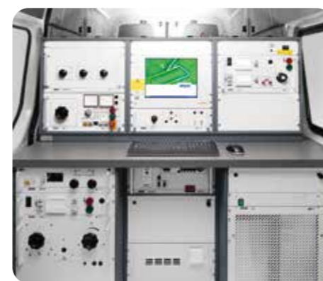
transcable 系统 ↑