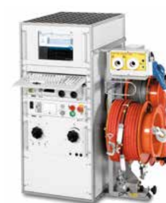
Syscompact 4000 ↑