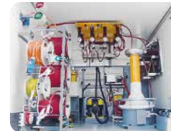
↑ 半自动 transcable 系统, 三相 110 kV