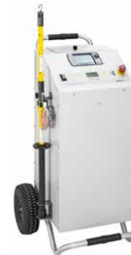
↑ Syscompact 2000 M pro 轻便、易用且耐候，因此是现场移动应用的理想之选。搬运手柄和大型滚轮可实现舒适运输，不受车辆限制。