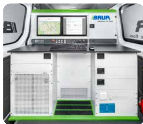
↑ titron® 系统