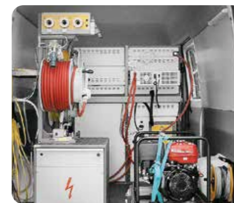
transcable 系统 ↑