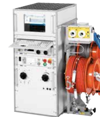
↑ Syscompact 4000 得益于使用 BAUR 软件 4 的创新操作设计以及集成定位方法，电缆故障定位更加快速、更加简便。