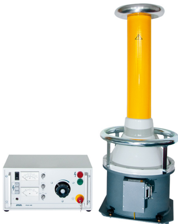
Figura de exemplo