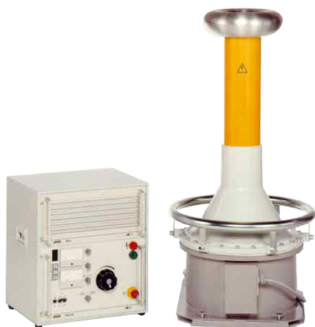
Figura de exemplo