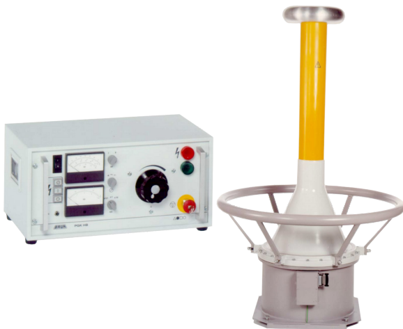
Obrázek je ilustrační.