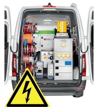
Abbildungen und Screenshot beispielhaft