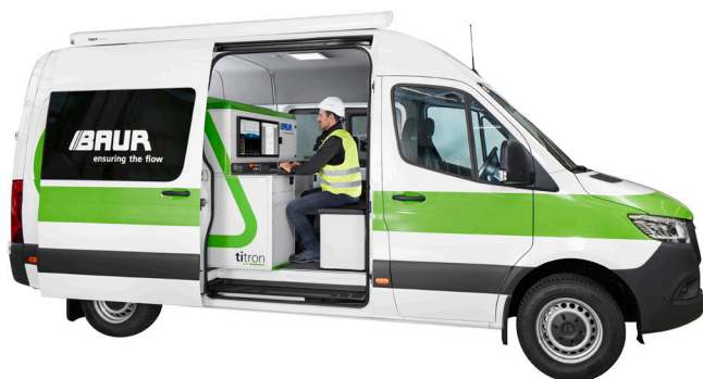
Figura a titolo esemplificativo