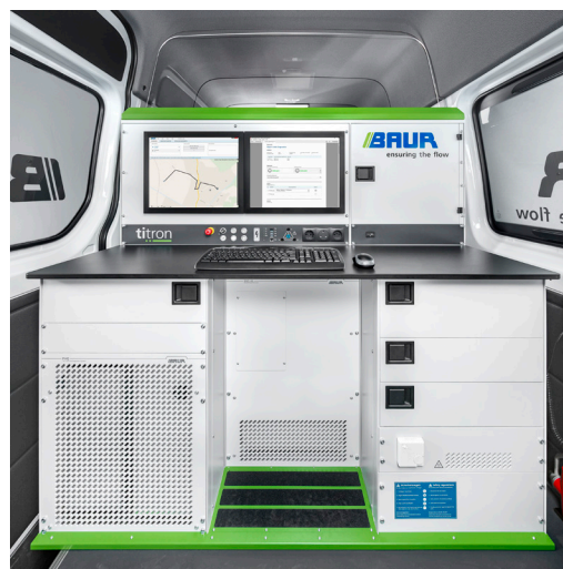
Figure a titolo esemplificativo