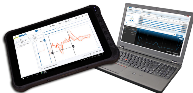
Control del IRG 400 mediante tableta u ordenador portátil (Ilustración a modo de ejemplo)