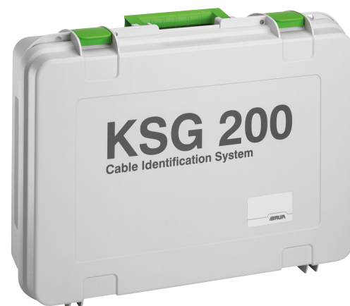
Afbeelding: KSG 200 T (zonder accu)