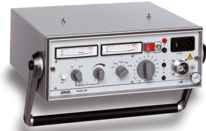
Ilustración a modo de ejemplo