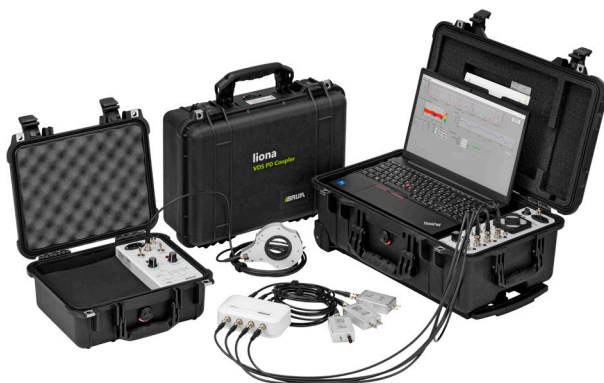
Figura: liona incl. acoplamento DP VDS VDS-C e Transponder iPD disponível opcionalmente