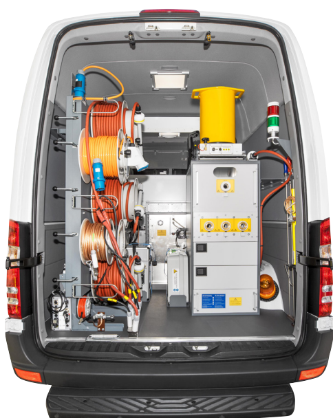
Ejemplo de integración en un vehículo de medición de cables

Requisito: Disponibilidad de las correspondientes funciones de software del software BAUR 4.