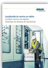
Localización de averías en cables Localizar averías con rapidez, minimizar los tiempos de inactividad