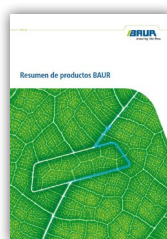
Resumen de productos