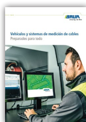
Vehículos y sistemas de medición de cables Preparados para todo