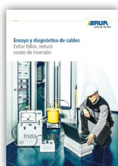
Ensayo y diagnóstico de cables Evitar fallos, reducir costes de inversión