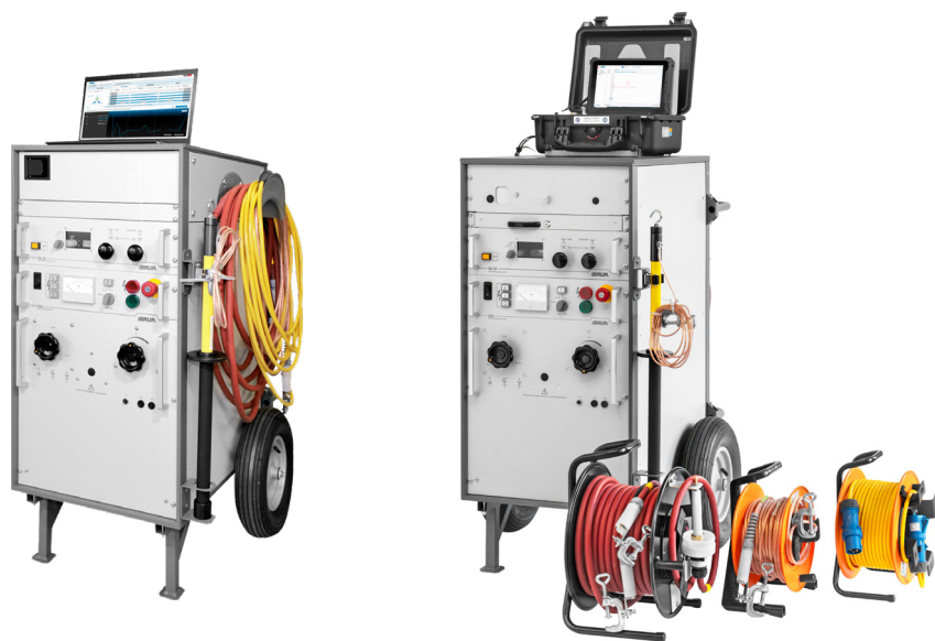
Figuras de exemplo

Sistema de localização de falha em cabo da BAUR