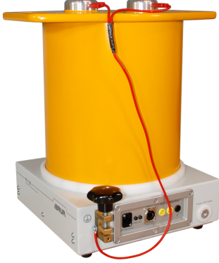
Şekil örnek amaçlıdır