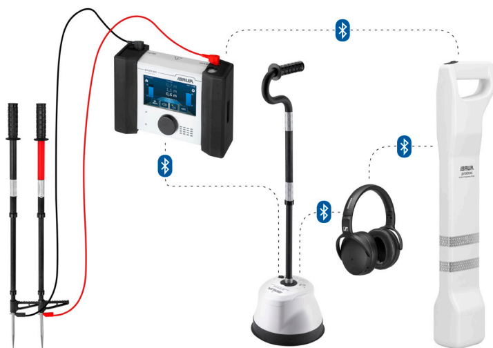
Figura de exemplo