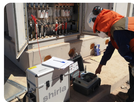
Прибор BAUR shirla в действии

Ключевым моментом стало решение использовать технологии компании BAUR для испытания и диагностики. Прежде всего, диагностические системы PHG 80 portable и PD-TaD 80 в сочетании с приборами для точной локализации, такими как Syscompact 2000