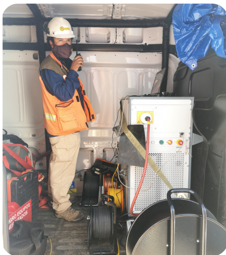
Система для испытаний СНЧ PHG 80 portable от компании BAUR

Больше всего сотрудников компании впечатлили системы PHG 80 portable и PD-TaD 80: «Никакие другие приборы не давали столь точных результатов с кабелями нашего размера». Это не только экономит время, но и значительно облегчает работу персонала на местах.