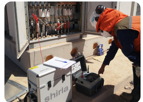
BAUR shirla im Einsatz

Kombination mit Ortungsgeräten wie Syscompact 2000 und shirla ermöglichten SAPRI eine völlig neue Herangehensweise bei Kabelprüfungen. Dank dieser Geräte war das Unternehmen in der Lage, präzise und zuverlässige VLF-Prüfungen bei 0,1 Hz durchzuführen – einschließlich Verlustfaktormessungen und Teilentladungsdiagnosen – selbst bei Kabeln mit Längen von bis zu 12 km und Querschnitten von 630 mm 2 .